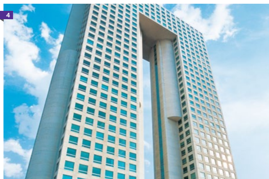
1. Rehabilitación del Centro Histórico, México, Distrito Federal. 2. Urbi Villa Santa Fe, Tijuana, Baja California. 3. Corporativo CEMEX, México, Distrito Federal. 4. Arcos Bosques Corporativo, México, Distrito Federal.